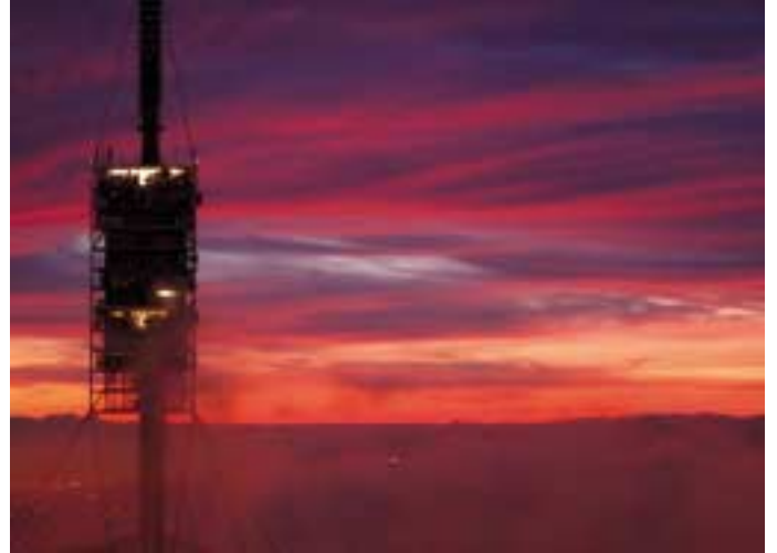
Raúl Giménez Valladares es el autor de la imagen titulada «Atardecer en Collserola».