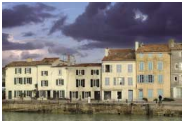
Esta evocadora fotografía, titulada «Después de la tormenta», es de nuestra compañera Nuria Mongil Manso.