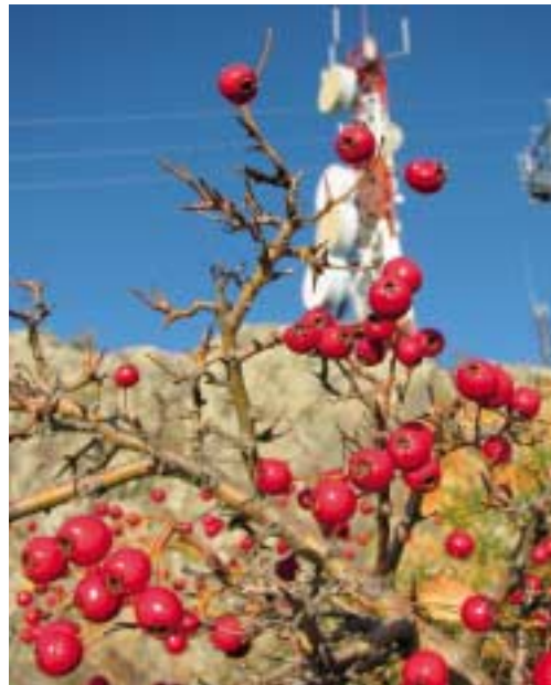
Esta estupenda foto, titulada «Comunicaciones rurales», es de nuestra compañera Tania Pinilla Villoslada.