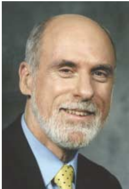
Vinton G. Cerf

En sus inicios, Internet era simplemente una herramienta para que la comunidad investigadora y educativa explorara nuevas formas de compartir recursos informáticos, programas e información a través del correo electrónico (que se po-