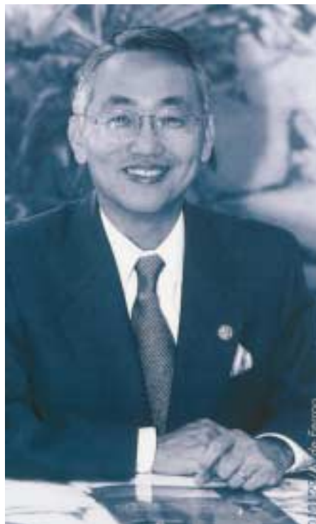
Yoshio Utsumi, Secretario General de la UIT

En el artículo que a continuación publica Antena , Vinton G. Cerf (uno de los padres de Internet) afirma que el amplio espectro del término «Gobierno de Inter-