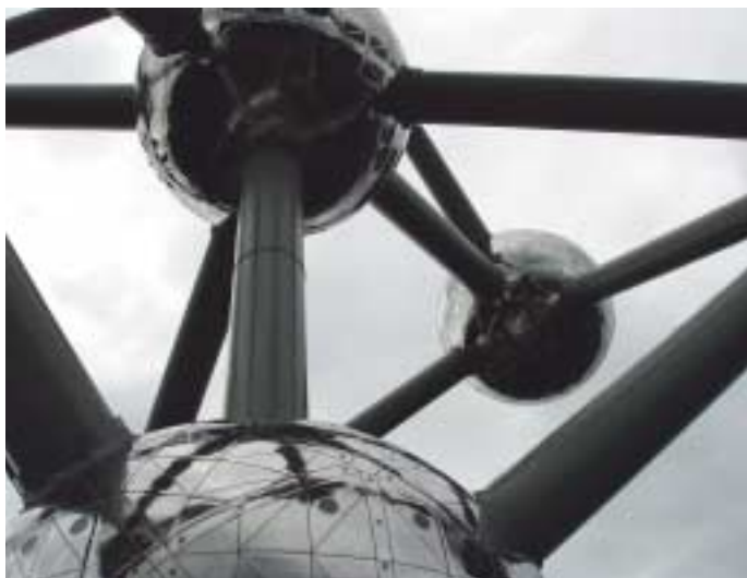
«Atomiun», de Carlos Cortés Alcalá.