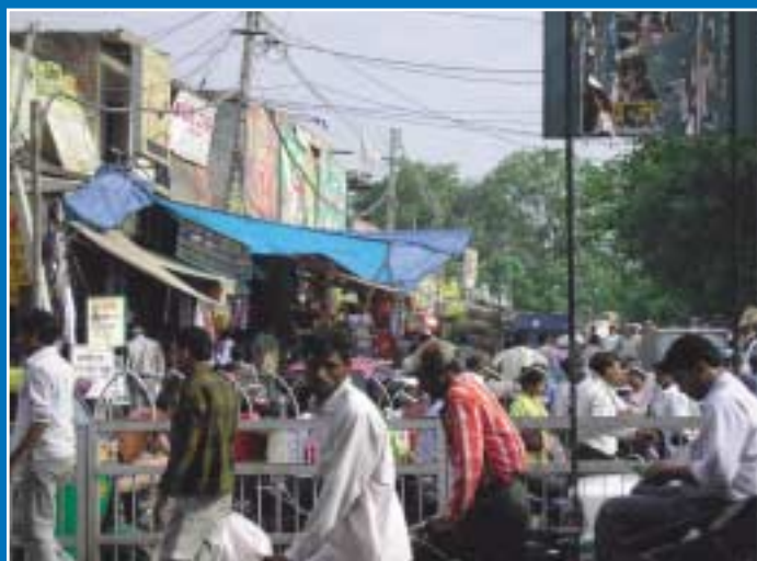
El autor es Antoni Moragues Galmés. La imagen va sin título.

Los tres ganadores ya tienen sus premios (las cámaras digitales) disponibles en el Colegio. Si alguno no pudiera acudir por cualquier razón, por favor mandad vuestras señas de correo a la siguiente dirección: prensa@coitt.es, y se os enviará el premio directamente a vuestro domicilio. En este número de Antena también hemos querido publicar las otras siete fotografías finalistas. Enhorabuena a los tres ganadores y a todos los que han participado en el concurso. ●