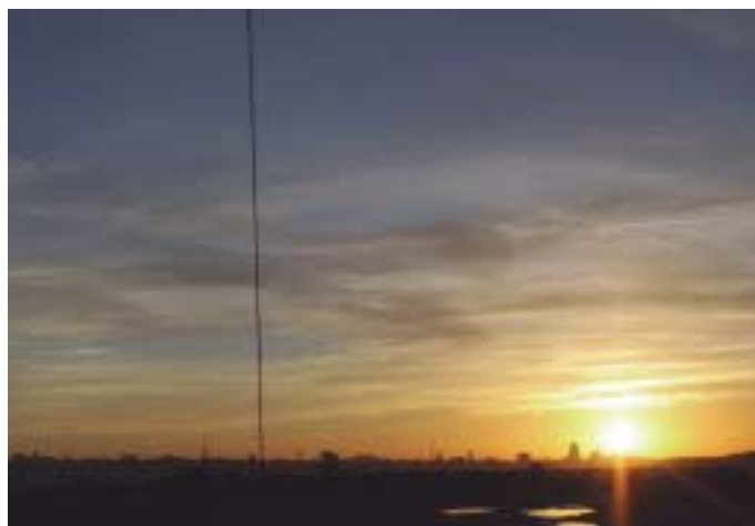
«Despierta Madrid», foto de José Daniel Lara.