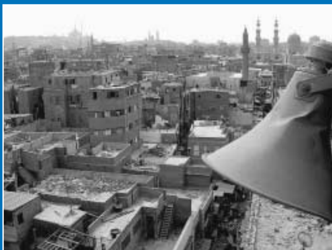
Su título: «Llamada a la oración sobre Khan el Khalil».

H emos vuelto a recibir una enorme cantidad de fotografías, todas de alta calidad, por lo que ha resultado francamente difícil elegir las que consideramos mejores. Una dificultad que se ha visto recompensada con la alta participación. Y precisamente por la gran acogida que ha tenido, hemos decidido convocar el IV Concurso de Fotografía del COITT. A partir de ahora tenéis a vuestra disposición la página web del Colegio para exhibir vuestros trabajos