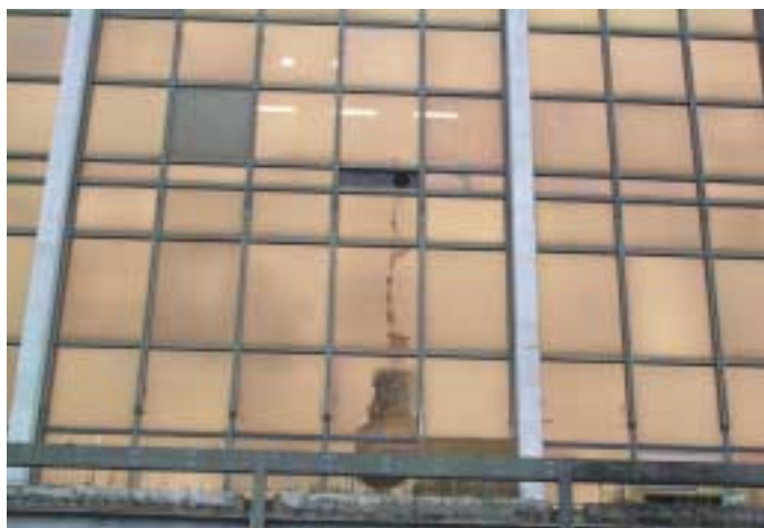
«Reflejos del mañana», imagen de Marc Seminago Gispert.

Los tres ganadores ya tienen sus premios (las cámaras digitales) disponibles en el Colegio. Si alguno no pudiera acudir por cualquier razón, por favor mandad vuestras señas de correo a la siguiente dirección: prensa@coitt.es, y se os enviará el premio directamente a vuestro domicilio. En este número de Antena también hemos querido publicar las otras siete fotografías finalistas. Enhorabuena a los tres ganadores y a todos los que han participado en el concurso. ●