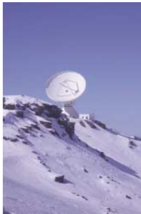
«En lo más alto», foto de Óscar Sánchez Fernández.

da a la oración sobre Khan el-khalili» (El Cairo). El Segundo Premio ha recaído en Alfredo Ruiz Tur, por su imagen «Viejo y nuevo» (Berlín). Finalmente, el Tercer Premio ha sido para Antoni Moragues Galmés, foto que va sin título.